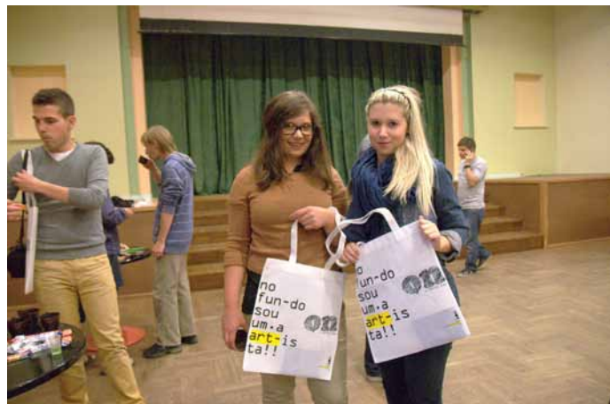
Na mednarodni večer so preizkušali različno hrano in pijačo, večer pa je popestril tudi nastop mlade estonske glasbene skupine. Udeleženci iz Madeire so soudeležence obdarili z ekološkimi vrečkami tamkajšnjega festivala, ki je primer dobrega reševanja težav v zvezi s socialno izključenostjo.