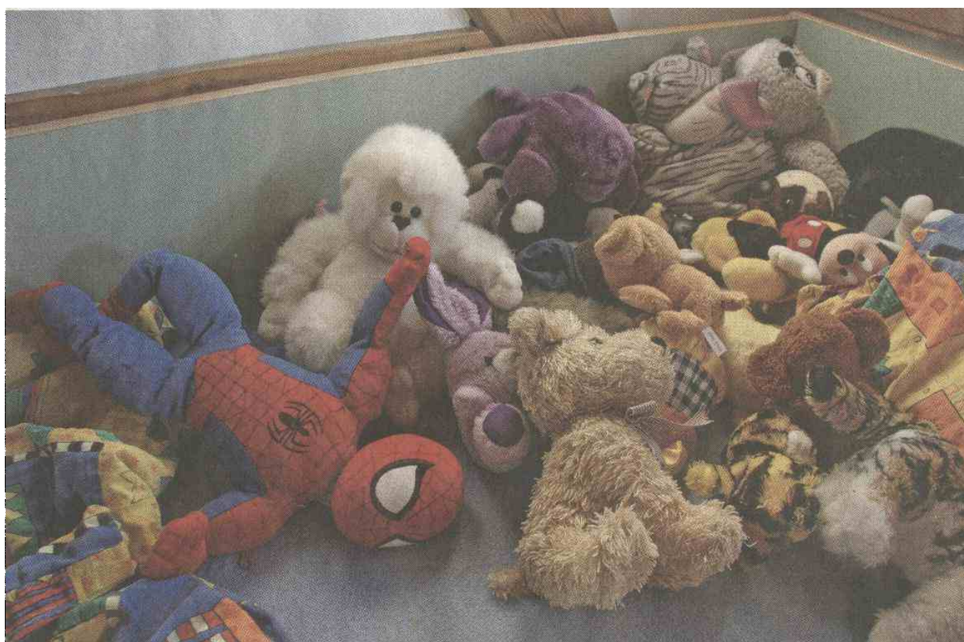
Igračke v sobici Erika, najmlajšega med njimi