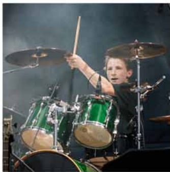
Moshead v akciji ...